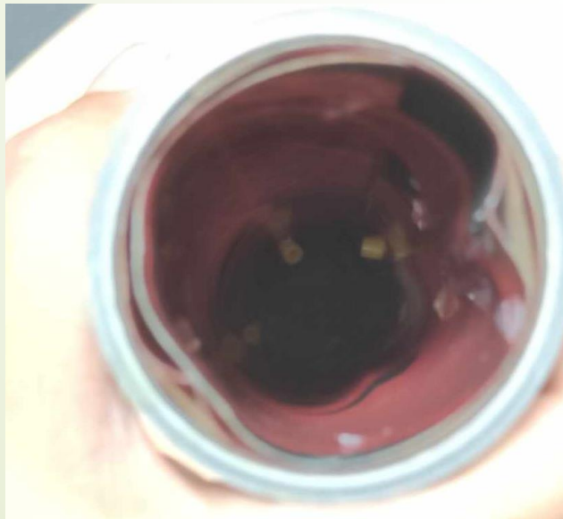
Vaisseaux 1: peu de « billes » de protéines